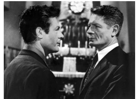
1959 LA DOUCEUR DE VIVRE (La dolce Vita) de Federico Fellini avec Marcello Mastroianni