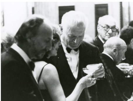
1982 LE QUATUOR BASILEUS (Il quartetto Basileus) de Fabio Carpi avec Hector Alterio