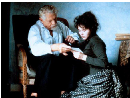
1988 CAMILLE CLAUDEL de Bruno Nuytten avec Isabelle Adjani