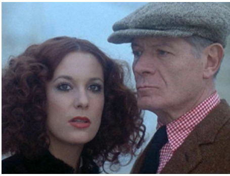
1971 VALPARAISO, VALPARAISO de Pascal Aubier avec Bernadette Lafont