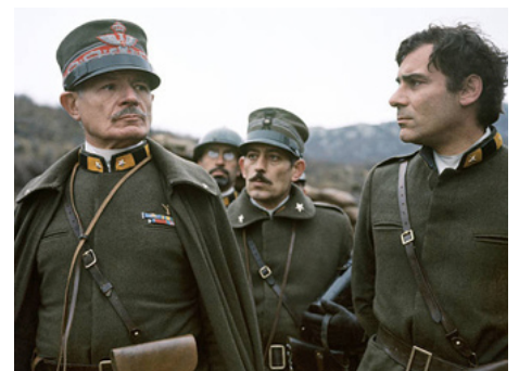
1970 LES HOMMES CONTRE (Uomini contro) de Francesco Rosi avec Gian Maria Volonte