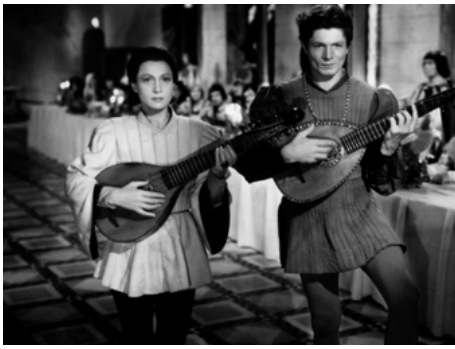
1942 LES VISITEURS DU SOIR de Marcel Carné avec Arletty