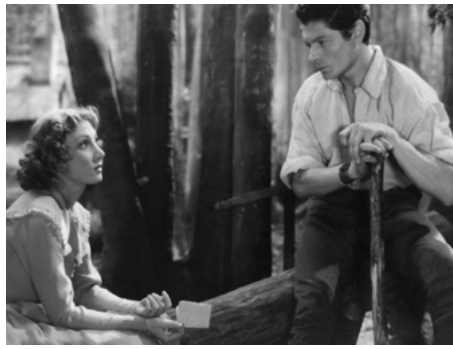
1942 LE BARON FANTÔME de Serge de Poligny avec Jany Holt