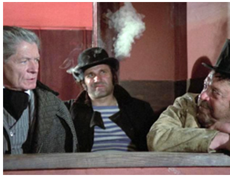
1972 LE MAÎTRE ET MARGUERITE (Il Maestro e Margherita) d'Aleksandar Petrovic avec M. de Ré