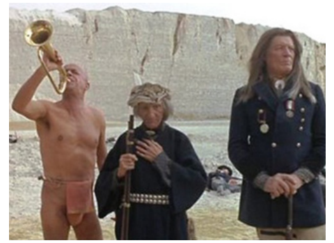
1973 TOUCHE PAS À LA FEMME BLANCHE de Marco Ferreri avec Serge Reggiani