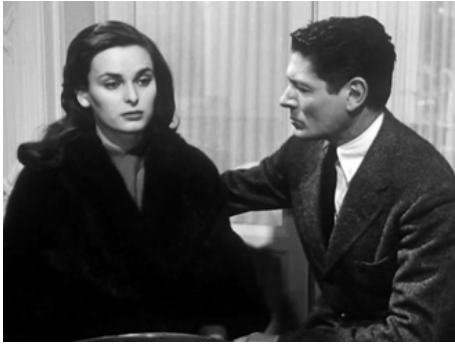
1951 LA DAME SANS CAMÉLIA (La Signora senza camelia) de Michelangelo Antonioni avec Lucia Bosé