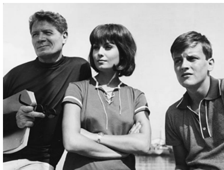
1963 LA CORRUPTION (La Corruzione) de Mauro Bolognini avec Rosanna Schiaffino, Jacques Perrin