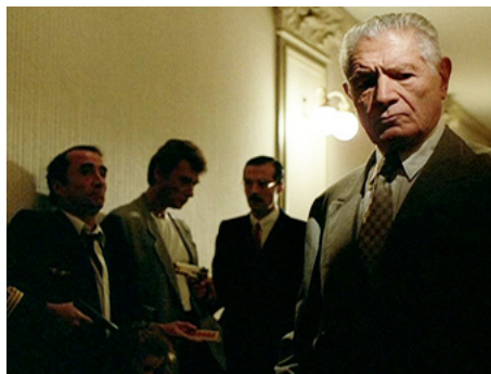
1984 DÉTECTIVE de Jean-Luc Godard avec Claude Brasseur, Johnny Hallyday