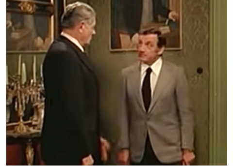
1975 CADAVRES EXQUIS (Cadaveri eccellenti) de Francesco Rosi avec Lino Ventura