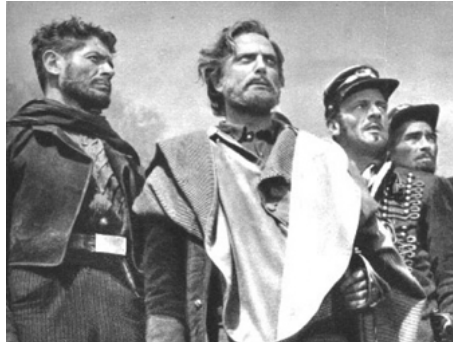
1952 LES CHEMISES ROUGES (Camicie rosse) de Goffredo Alessandrini avec Raf Vallone