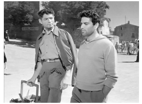
1950 LE CHRIST INTERDIT (Il Cristo proibito) de Curzio Malaparte avec Raf Vallone