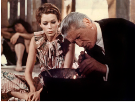
1973 EMMANUELLE de Just Jaeckin avec Sylvia Kristel