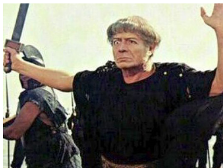
1969 SATYRICON (Fellini Satyricon) de Federico Fellini