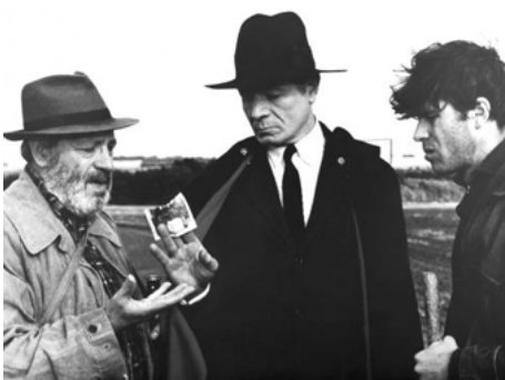
1968 LA VOIE LACTÉE de Luis Buñuel avec Paul Frankeur, Laurent Terzieff