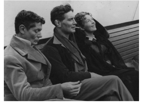
1952 LES CRIMES DE L'AMOUR, Mina de Vanghel de Maurice Barry avec Jean Servais, Odile Versois