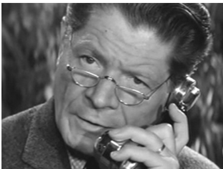
1963 PEAU DE BANANE de Marcel Ophüls