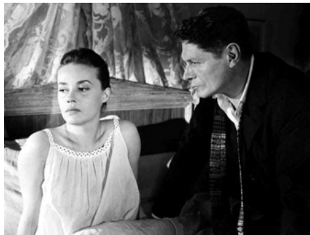
1958 LES AMANTS de Louis Malle avec Jeanne Moreau