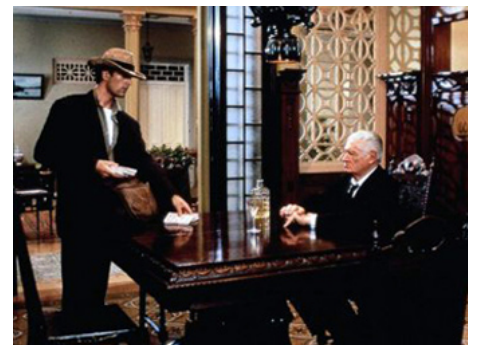
1986 CHRONIQUE D'UNE MORT ANNONCÉE de Francesco Rosi avec Rupert Everett